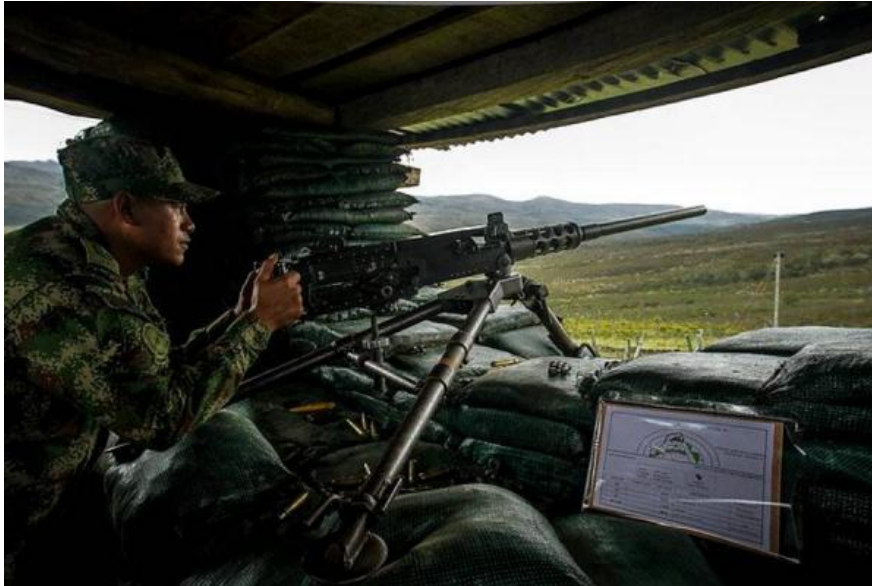
Conflicto siguió vivo aún con la tregua de las Farc